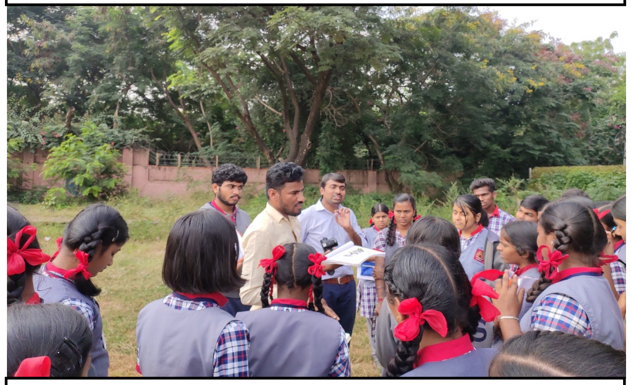
IFB Staff explaining about the Herbarium preparation to Students of KVS, Gachibowli