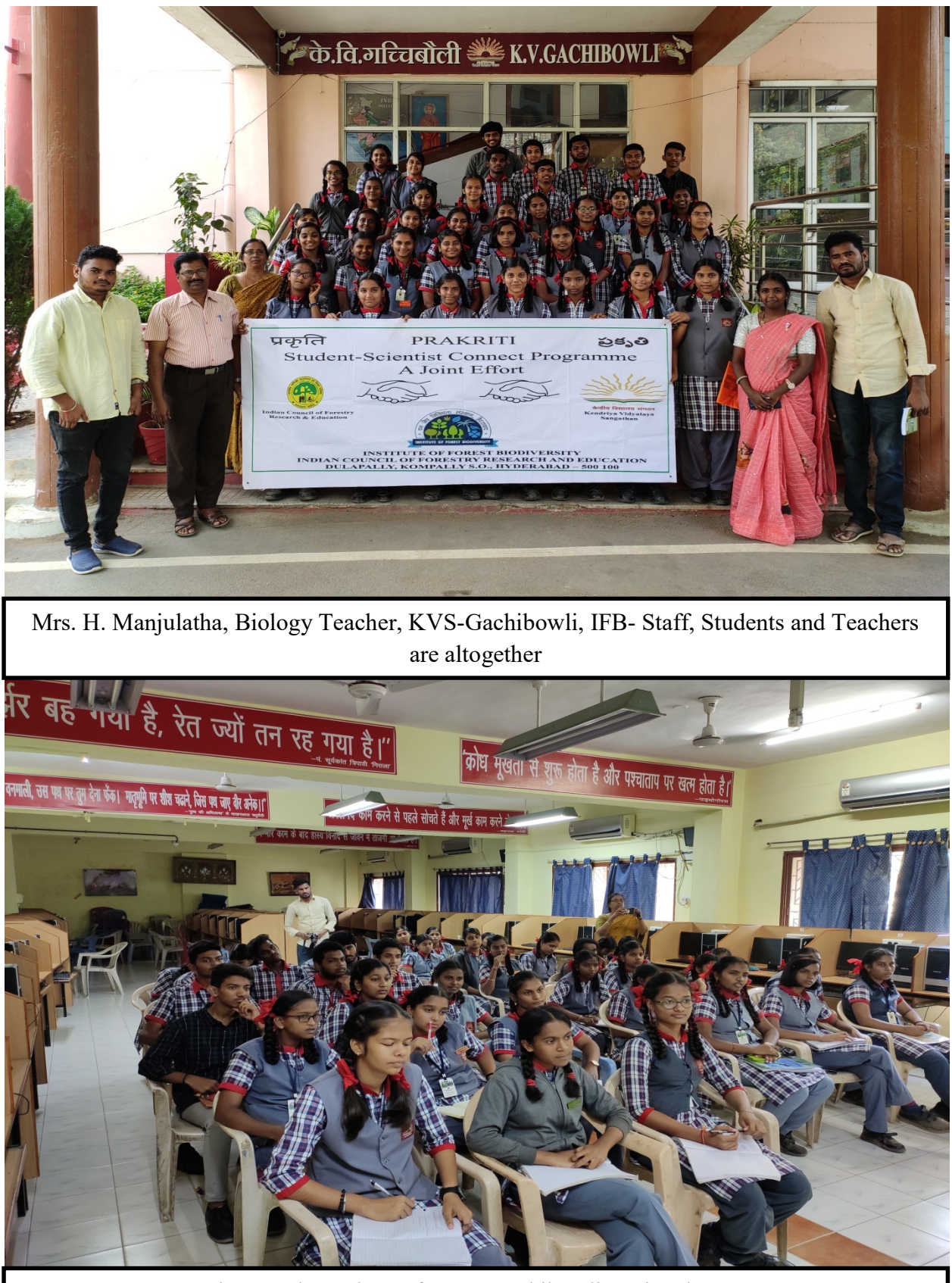
Students and Teachers of KVS, Gachibowli are in Classroom