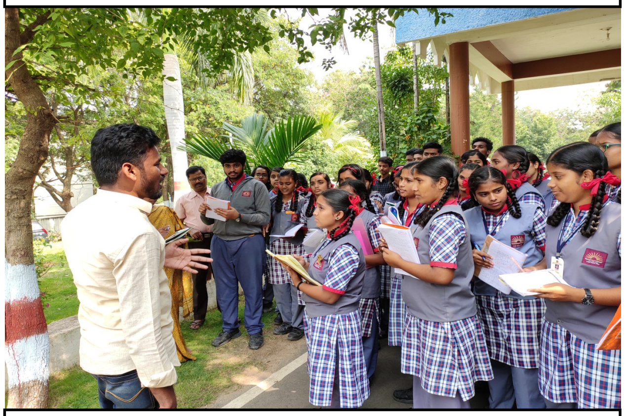
IFB Staff explaining about the plant identification to Students of KVS, Gachibowli