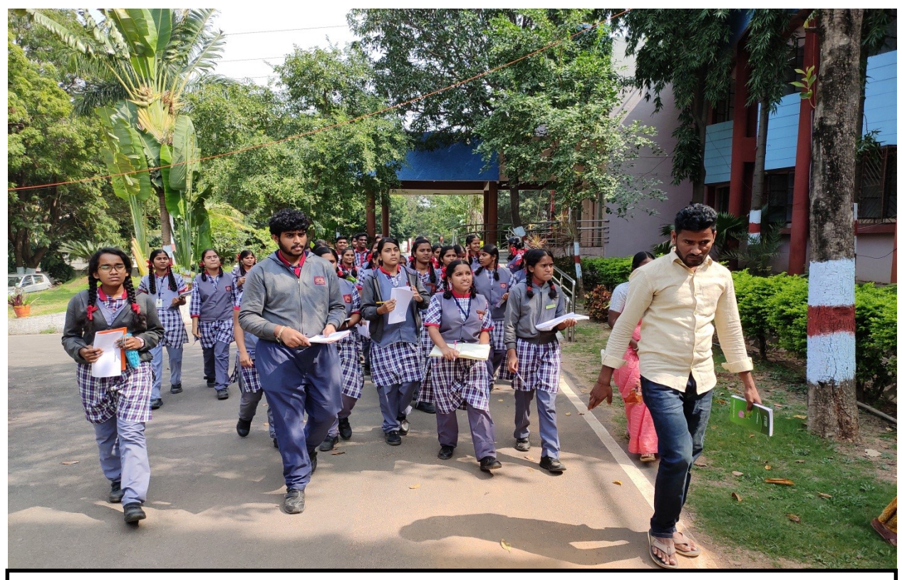
IFB Staff, Students and Teachers of KVS, Gachibowli is in Biodiversity walk at KVS