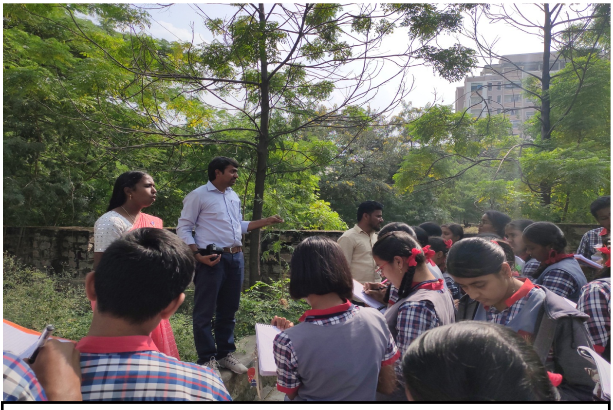
IFB Staff explaining about the plant identification to Students of KVS, Gachibowli